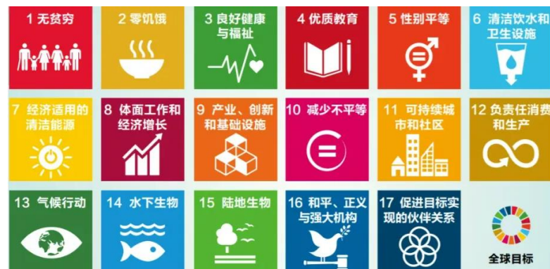
表1中的每个目标都直接响应了联合国的17个可持续发展目标（SDGs）。这再次重申了我们对联合国全球契约及其目标的支持。